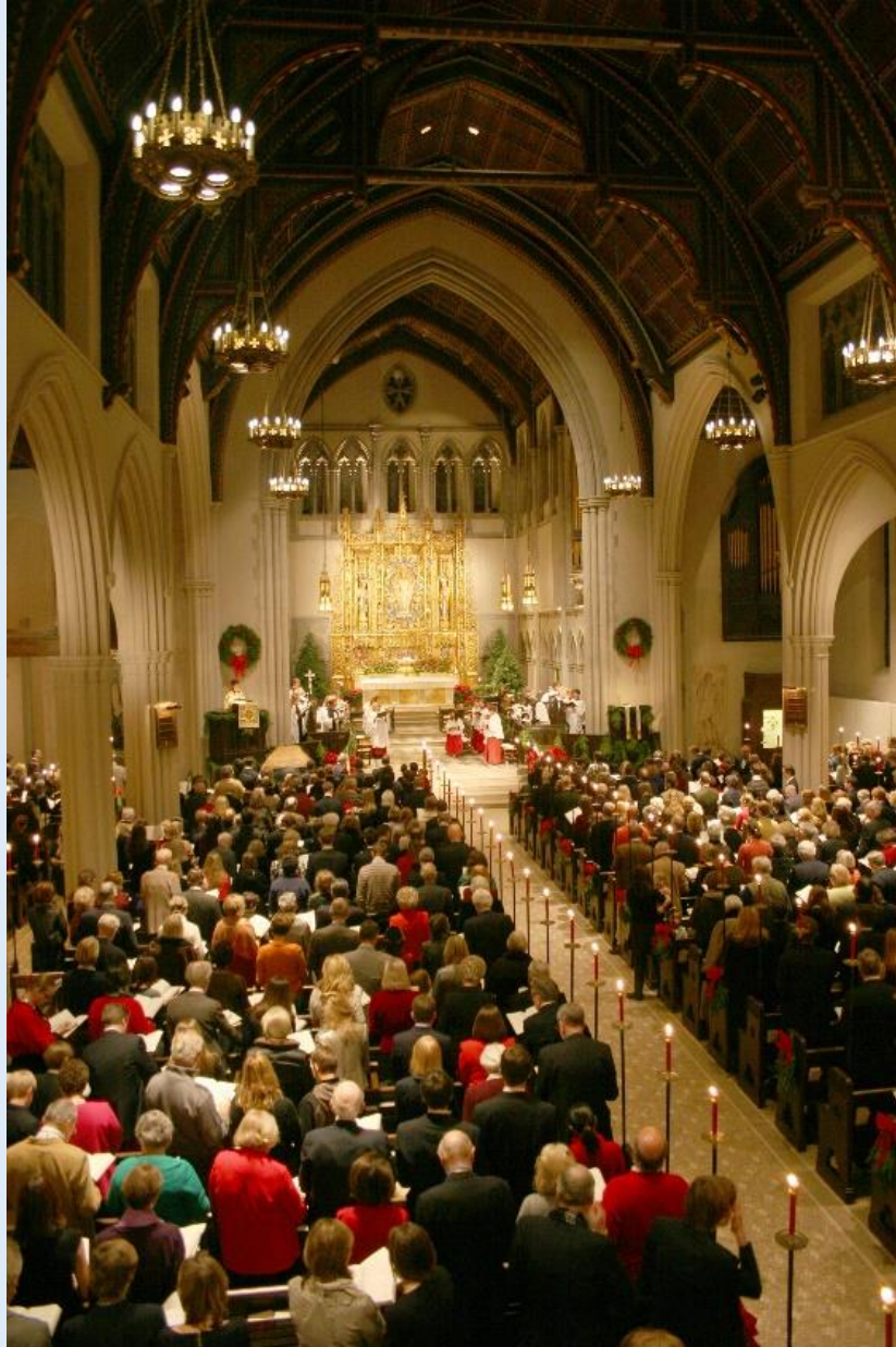
Biserica Sf. Iacob - Lucrări proprii, Ajunul Crăciunului 2004, Biserica Sf. James (Episcopală), New York City