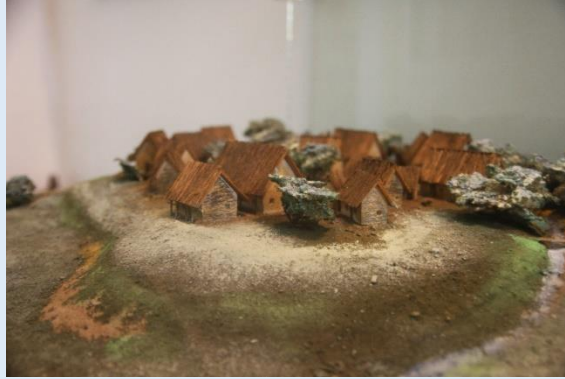
Bir Cucuteni Köyünün Ölçekli Yeniden Üretimi . Piatra Neamt Müzesi