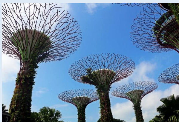
Singapore, Fotografie de Neha Maheen Mahfin de la Pexels